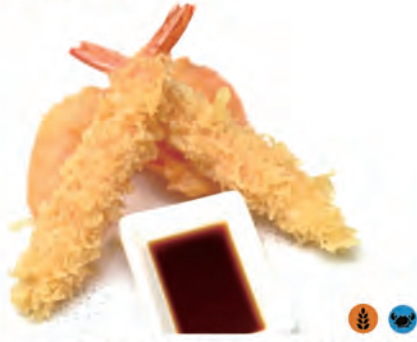
145. TEMPURA MISTA verdure miste di stagioni e gamberoni