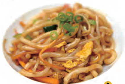
116. YASAI UDON spaghetti di udon,uova,verdure