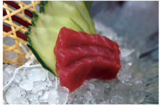
① 96. TUNA SASHIMI tonno