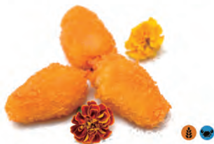
151. CHELE DI GRANCHIO