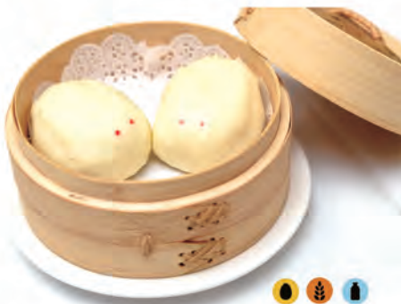
242. PANE DOLCE CINESE pane crema alla vapore