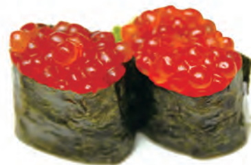
54. GUNKAN IKURA alghe, uova di salmone