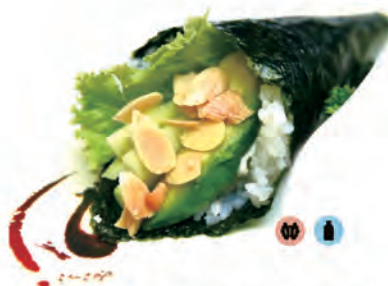
65. VEGAN TEMAKI avocado,insalata,cetrioli,philadelphia e mandorle