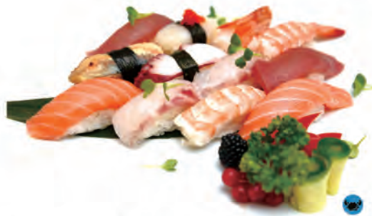
38. NIGIRI MISTO C 2pz salmone, 2pz tonno, 2pz gamberi, 2pz branzino 1pz polipo, 1pz anguilla, 1pz amaebi, 1pz capesante