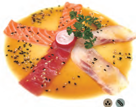
105. CARPACCIO MISTO salmone, tonno, branzino in salsa osaka