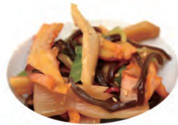
10. INSALATA DI TOTANI alghe, bambu, funghi, peperoni