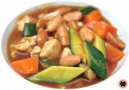
129. POLLO MANDORLE carote,zucchine,pollo,mandorle