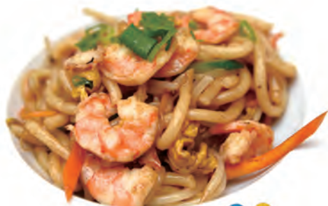
118. YAKI UDON spaghetti udon,uova con gamberi