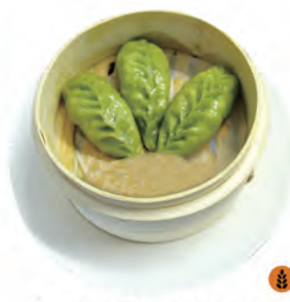
274. RAVIOLI VERDURE verdure