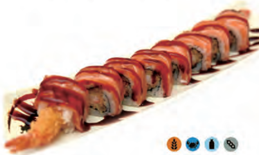
73. TIGER ROLL gambero fritto con salmone, maionese, salsa anago