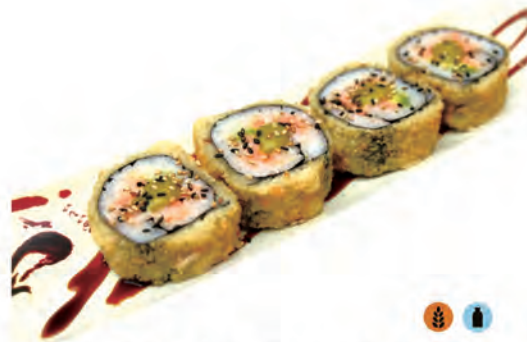
90. MIX FUTOMAKI salmone,philadelphia,avocado