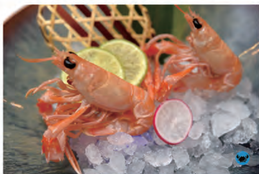
98. SCAMPI scampi

1pz ostriche, 1pz gamberi rosso, 1pz, scampi, 3pz sashimi salmone, 3pz tonno, 3pz branzino, 1pz capesante