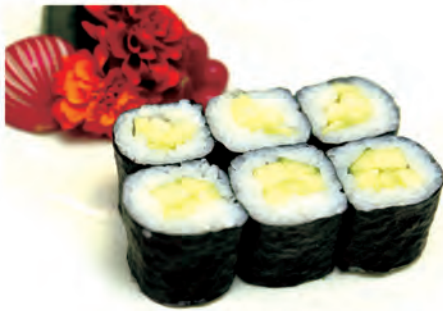
42. CETRIOLO MAKI cetriolo