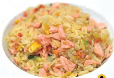
112. RISO CON SALMONE