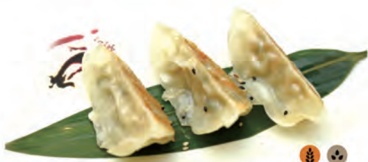
153. RAVIOLI DI POLLO GRIGLIA