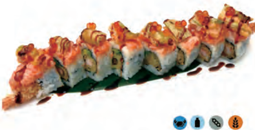
209. URA SUNSET gamberi in tempura, maionese, all'esterno tartare di salmone, fiori di zucca in tempura, ikura salsa anago