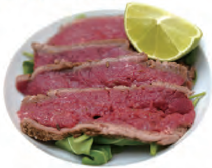
①17. ANTIPASTI DI MANZO manzo alla griglia