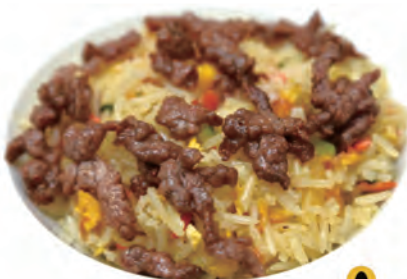
114. RISO SALTATO CON MANZO