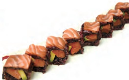
216. BLACK SALMON salmone, avocado, all'esterno salmone