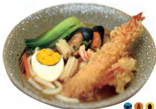
126. UDON SUPO udon in brodo, frutti di mare, uova cipollotti