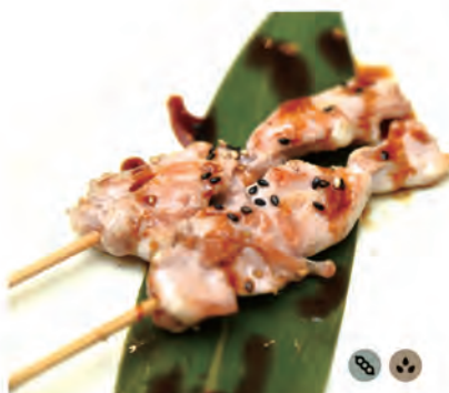
158. YAKI TORI spiedini di pollo in salsa kabayaki