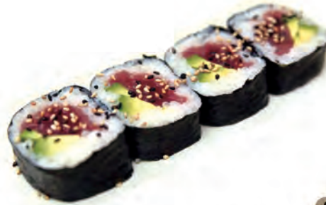
88. TUNA FUTOMAKI tonno,avocado