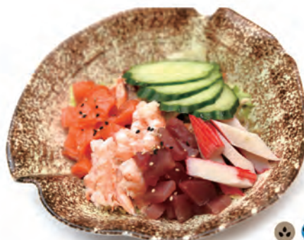
19. INSALATA MISTO cetriolo, salmone, tonno, surimi, gamberi salsa sesamo