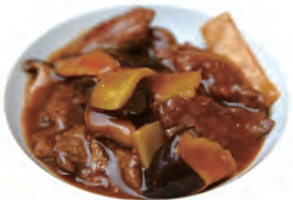
134. MANZO CON BAMBU E FUNGHI manzo,bambu,funghi,shacha