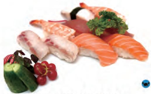
37. NIGIRI MISTO B 2pz salmone, 2pz tonno, 2pz gamberi 2pz branzino, 1pz polipo