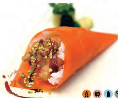
205. TEMAKI FLOREALE tartare di gamberi, fiori di zucca, salsa teriyaki,kataifi,alga speciale