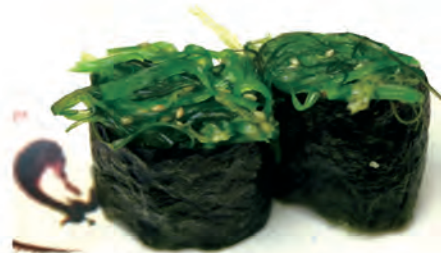
52. GUNKAN WAKAME alghe, wakame