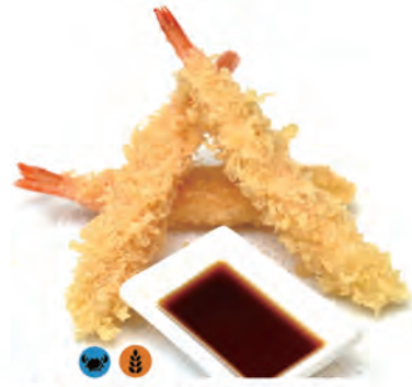
146. TEMPURA EBI gamberoni fritti