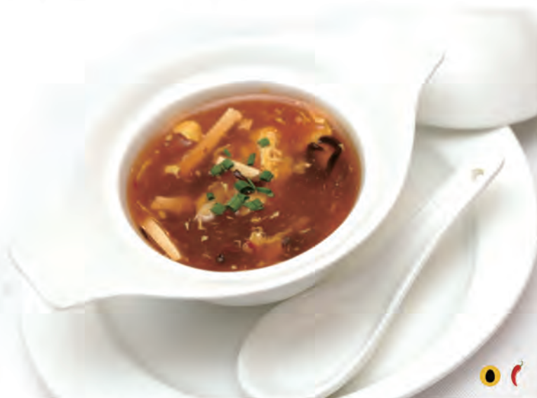
22. ZUPPA DI AGROPICCANTE tofu, bambu, funghi, piccante, aceto