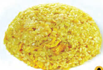
115. RISO AL CURRY