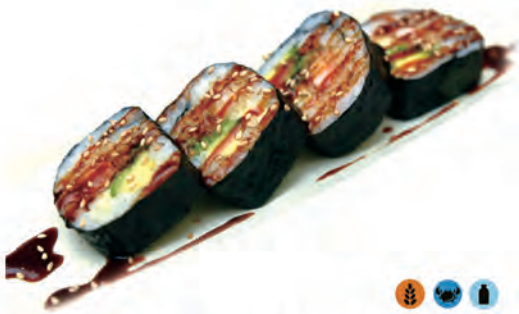
89. TEMPURA FUTOMAKI gambero fritto,maionese,avocado