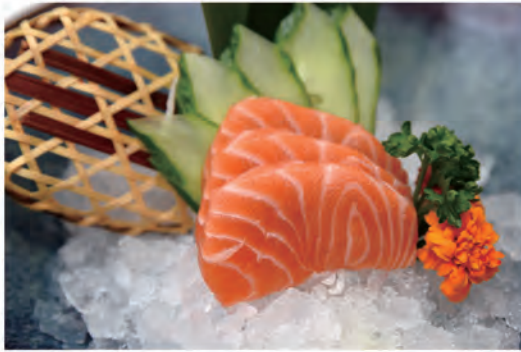
95. SAKE SASHIMI salmone