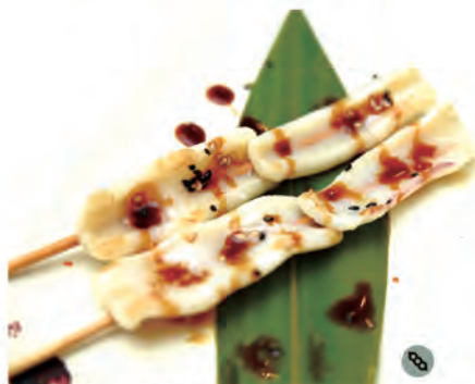
159. IKA TERIYAKI calamari alla griglia con salsa kabayaki