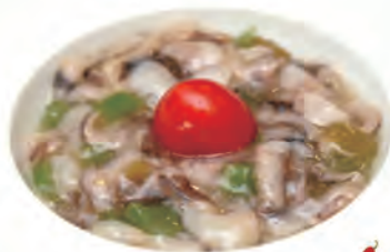
13. INSALATA DI POLIPO polipo, peperoni, wasabi salsa di soia