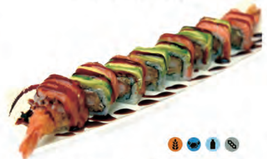
72. DRAGON ROLL gamberi fritto, philadelphia, avocado, salmone in salsa anago