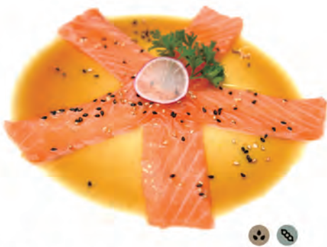
102. CARPACCIO SALMONE salmone in salsa osaka