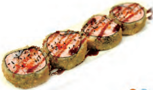
91. FRITTO MAKI salmone,philadelphia