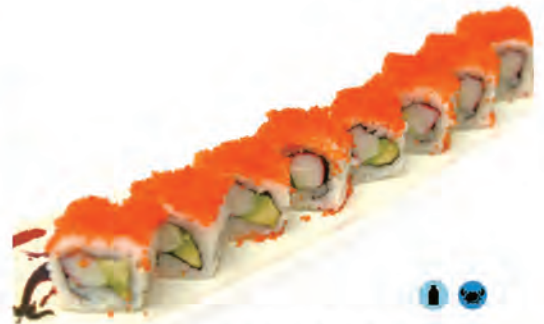
70. TOBIKO ROLL granchio, avocado maionese con pesce di uova