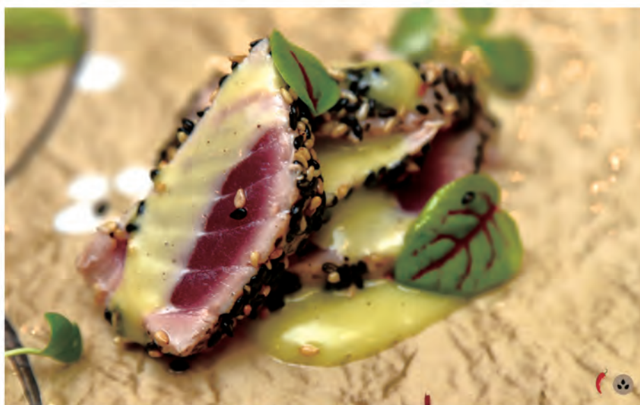
① 164. TONNO TATAKI tonno in salsa speciale

i piatti con numero ① si devono ordinare una volta sola per persona