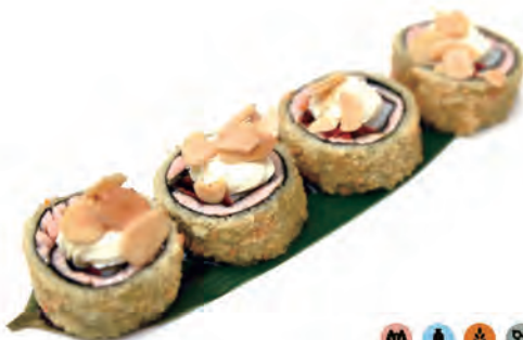
221. SALMON NINJA philadelphia,surimi,tobiko, salmone,avocado,salsa teriyaki