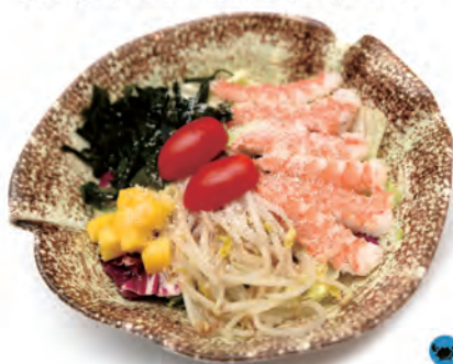
20. TAI SALA gamberi, alghe, mango, fagioli di soia in salsa latte di cocco