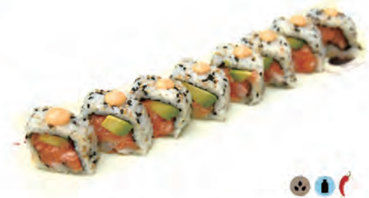
86. SPICY SALMON salmone tartar, avocado, maionese insalata, salsa spicy