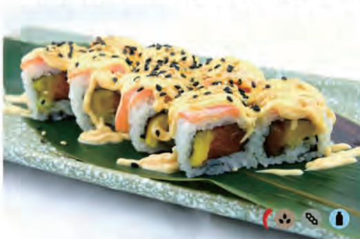
213. MANGO FLAMBE salmone, mango, all'esterno maionese piccante, salmone alla fiamma, salsa teriyaki, sesamo