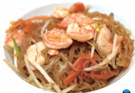
125. SPAGHETTI DI SOIA CON GAMBERI spaghetti di soia con gamberi e verdure