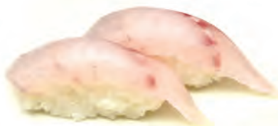
26. SUZUKI branzino crudo