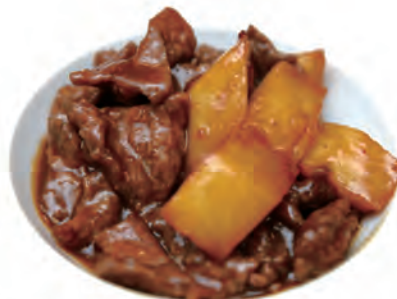
135. MANZO CON PATATE manzo,patate,saltate di shacha