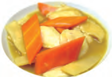
132. POLLO CURRY pollo,bambu,carote,curry