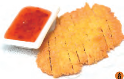
152. COTOLETTA DI POLLO