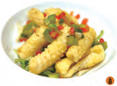
231. CALAMARI CON SALE E PEPE calamari fritti, sale e pepe, verdure e cipolle