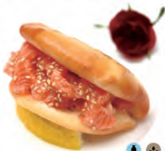
263. MO SALMON pane fritto, salmone, maionese