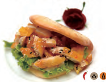
264. MO CHICKEN pollo fritti, insalata, salsa agrodolce

i piatti con numero ① si devono ordinare una volta sola per persona