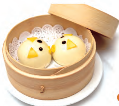
05. PANE OSAKA dolce speciale