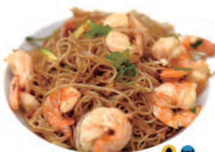
123. SPAGHETTI DI RISO CON GAMBERI spaghetti di riso con gamberi e verdure