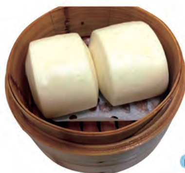
07. PANE AL VAPORE