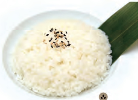
108.GOHAN riso bianco