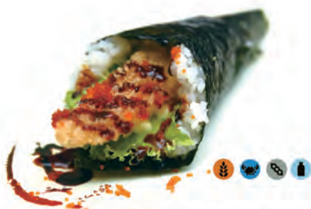
66. TEMPURA TEMAKI gambero fritto,insalata,tobiko,salsa anago