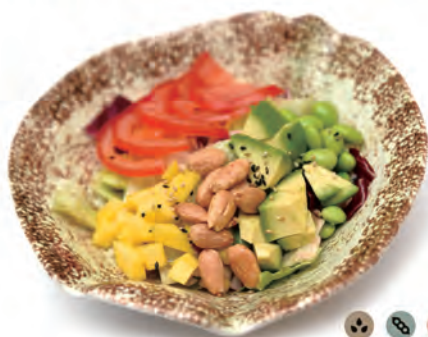
18. VEGAN SALA pomodoro, avocado, mandorle, mango, edamame, salsa ponzu