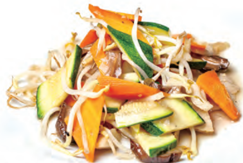
144. VERDURE MISTI SALTATO