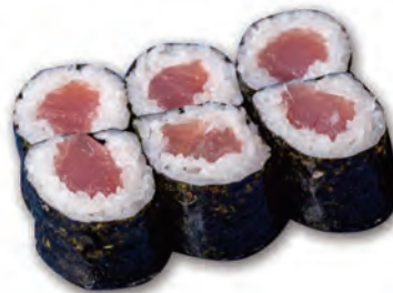
46. TEKKA MAKI tonno