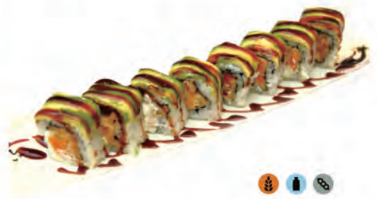
74. ZUCCA ROLL zucca di fritti, philadelphia, avocado salsa teriyaki