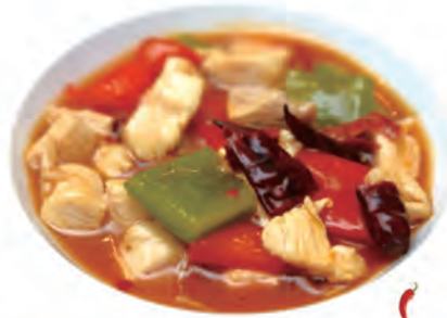
130. POLLO PICCANTE pollo,peperoni piccante