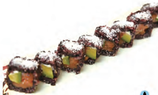
215. BLACK PHILADELPHIA salmone, avocado, philadelphia, farina di cocco