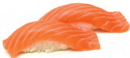
24. SAKE salmone crudo