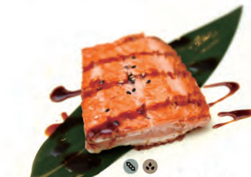
160. SAKE ALLA GRIGLIA salmone alla griglia con salsa kabayaki