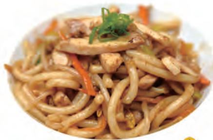
117. POLLO UDON spaghetti di udon,pollo,verdure