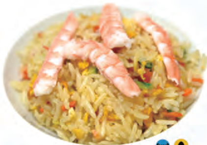
110. RISO SALTATO CON GAMBERI