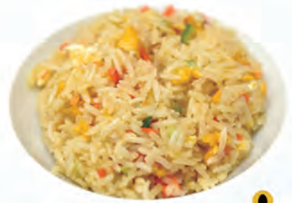
109. RISO SALTATO CON VERDURE