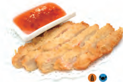
238. COTOLETTA DI GAMBERI gamberi con pannatura