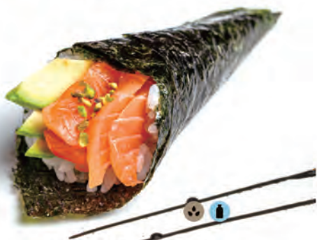
60. SAKE TEMAKI salmone,avocado,philadelphia