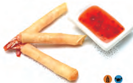
16. STICK GAMBERI