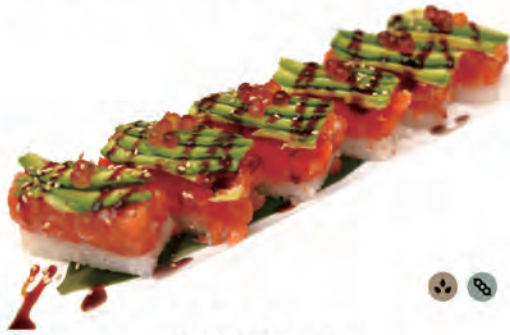
83. GYNZA salmone tartar, ikura, tobiko avocado in salsa teriyaki