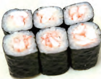
47. EBI MAKI gambero cotto