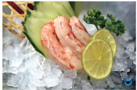
101.AMAEBI gamberi crudo