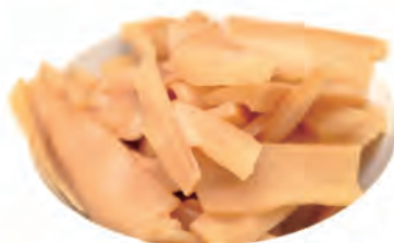
240. GERMOGLI DI BAMBU