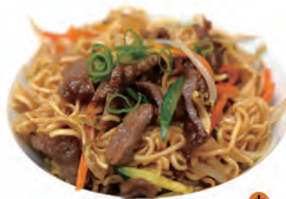
121. MANZO SOBA spaghetti di soba con manzo e verdure