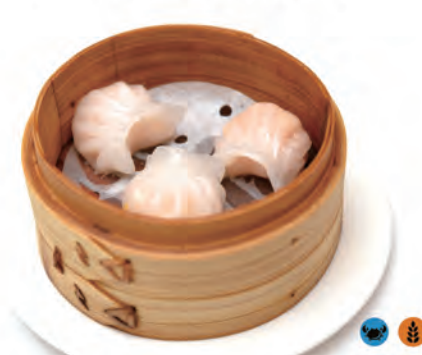
08. RAVIOLI DI GAMBERI carne e gamberi