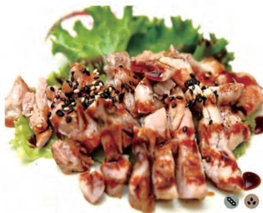
162. PETTO DI POLLO pollo in salsa kabayaki