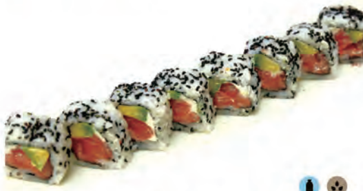
67. PHILADELPHIA salmone, philadelphia e avocado