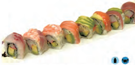
69. RAINBOW ROLL granchio, avocado, pesce misto, maionese