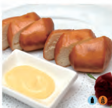
02. PANE CINESE pane fritto