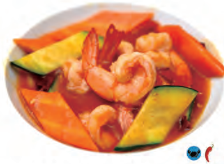
230. GAMBERI THAI gamberi, verdure, salsa piccante thailandese