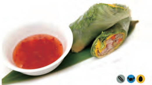
15. INVOLTINI PRIMAVERA VIETNAMITI insalata, gamberi cotti, carote, uova, maionese