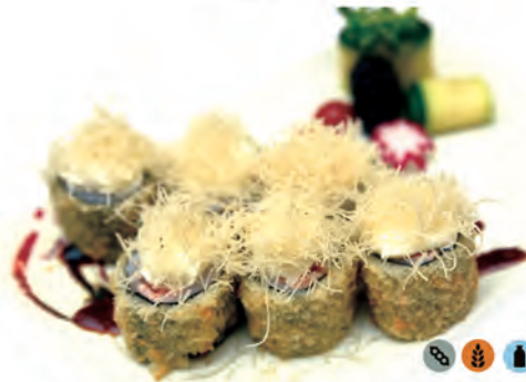
48. SAKI PHILADELPHIA FRITTO salmone, philadelphia, kataifi, fritto