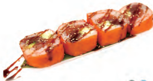
92. FUTO ZU salmone,avocado,tonno,philadelphia,cetrioli salsa teriyaki