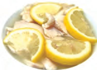
133. POLLO AL LIMONE pollo, limone