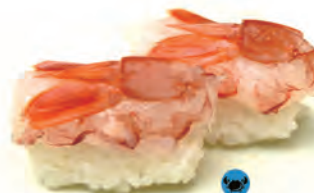
29. AMAEBI gamberi crudo