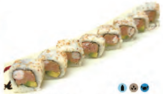
68. CALIFORNIA tonno cotto, avocado, gamberi cotto, maionese