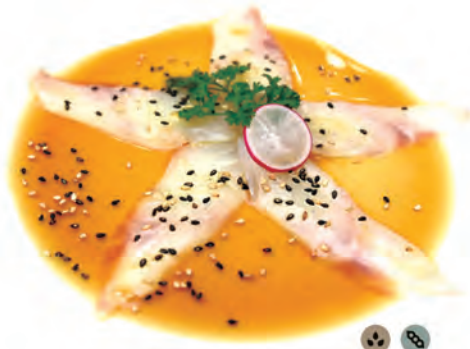
103. CARPACCIO SUZUKI branzino in salsa osaka