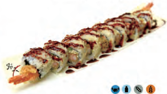
210. RAKKI ROLL gambero in tempura avocado, surimi, maionese, tobikko, all'esterno chips e salsa teriyaki