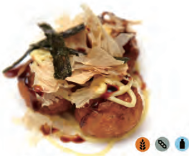
236. TAKOYAKI seppia, flocchi di bonito secchi affumicati alga nori, maionese in salsa teriyaki