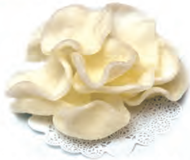
09. NUVOLETTE DI DRAGO