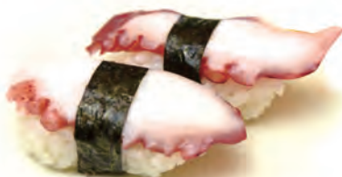
30. POLIPO polipo