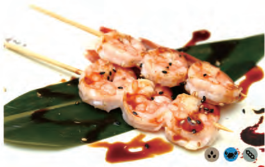
157. EBI TORI spiedini di gamberi in salsa kabayaki