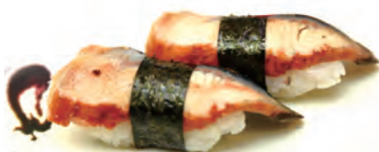
28. UNAGI anguilla