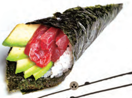
61. TUNA TEMAKI tonno,avocado