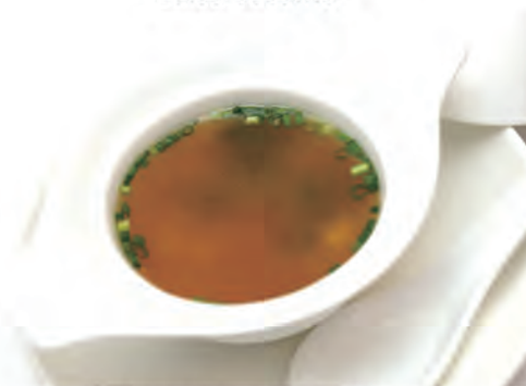
21. ZUPPA DI MISO tofu, alghe, cipolline, funghi