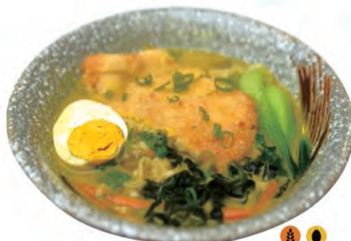
127. CHICKEN RAMEN ramen in brodo, cotoletta di pollo, uova, carote, wakame, cipollotti