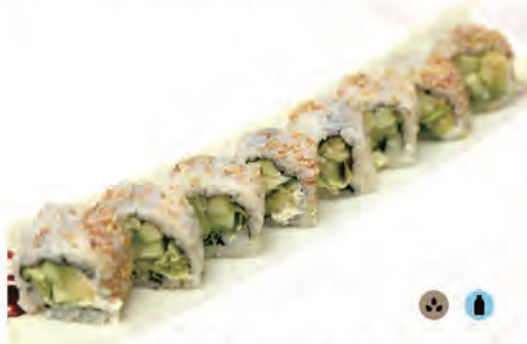
71. GEGANROLL philadelphia, insalata, avocado, cetrioli