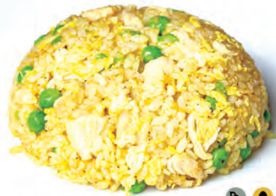
111.RISO SALTATO CON POLLO