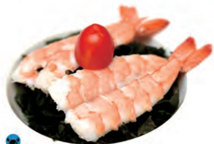
14. EBI SU gamberetti con alga