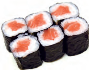
45. SAKI MAKI salmone