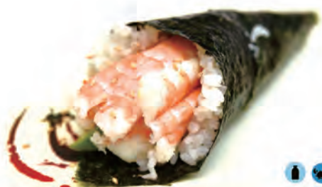
64. EBI TEMAKI gambero cotto, philadelphia, avocado