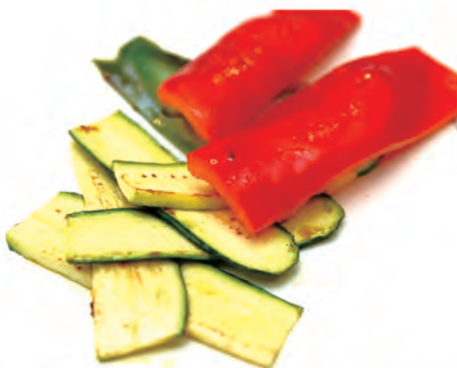
163. VERDURE MISTE ALLA GRIGLIA