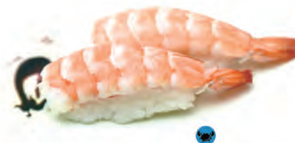
27. EBI gamberi cotto