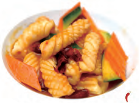
229. CALAMARI THAI calamari, salsa piccante thailandese, verdure