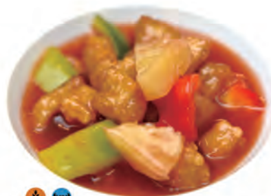
137. GAMBERI CON AGRODOLCE gamberi fritto,ananas,peperoni,agrodolce