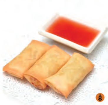
01. INVOLTINI DI PRIMAVERA verdure