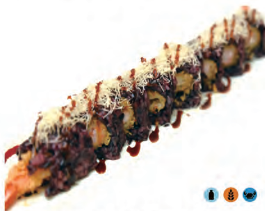
217. BLACK EBITEN tempura di gamberi, maionese, kataifi, salsa teriyaki