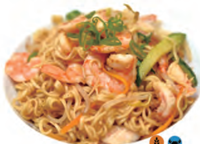
120. YAKI SOBA soba,verdure con gamberi e verdure