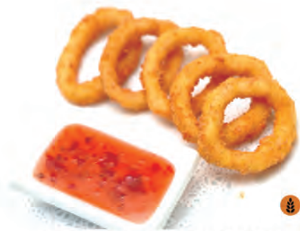
148. TEMPURA CALAMARI calamari fritti