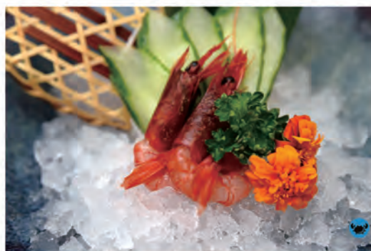
99.GAMBERI ROSSI gamberi crudo rossi

In questa pagina si puo ordinare una volta sola per persona tra i questi piatti