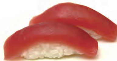
25. MAGURO tonno crudo