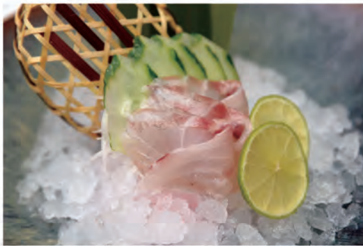
97. SUZUKI SASHIMI branzino