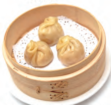
03. XIAO LONG BAO AL VAPORE carne