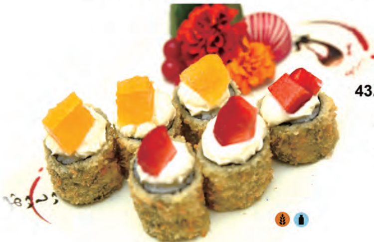
43. HOSO PHILL FRUTTA philadelphia e avocado avvolti da kataifi in tempura, arancia, fragole