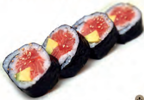
87. SAKE FUTOMAKI salmone,avocado