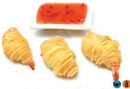
149. POTATO SHZIMP polpette di pesce con patate al gusto di mazzancolle tropicali