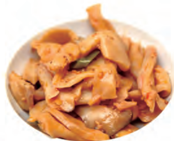
239. FUNGHI CARDONCELLI funghi cardoncelli, piccante, peperoni