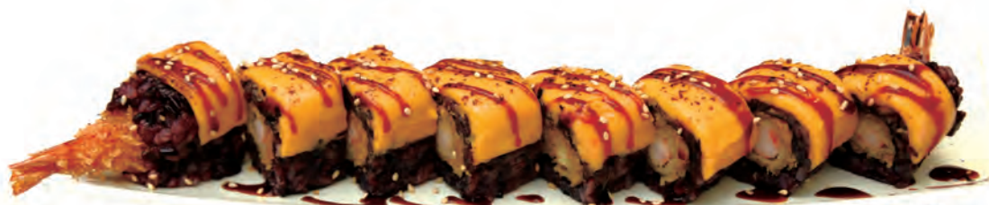
258. BLACK DRAGON tempura di gamberi, esterno formaggio, salsa teriyaki