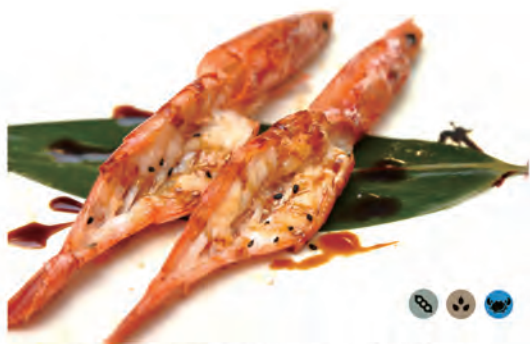
155. GAMBERONI ALLA GRIGLIA