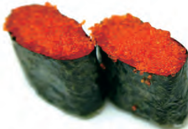
53. GUNKAN TOBIKO alghe, uova di volante