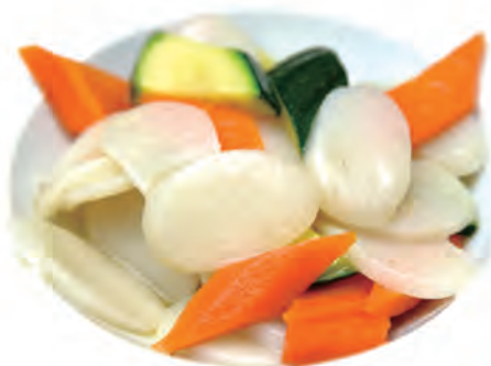
128. GNOCCHI DI RISO gnocchi di riso saltato con verdure miste