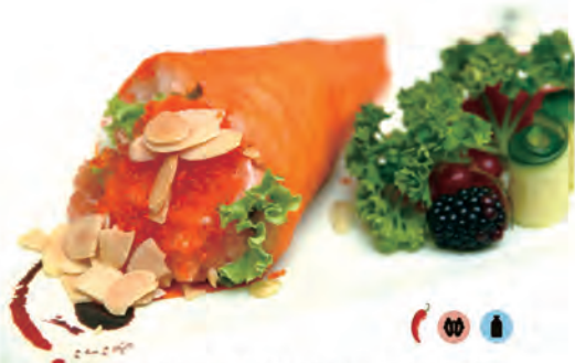
62. SPICY SALMONE TEMAKI salmone,insalata,tobiko, spicy maionese,mandorle