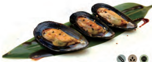
154. COZZE A MEZZO GUSCIO cozze alla griglia con salsa kabayaki