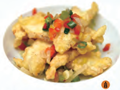
232. BRANZINO CON SALE E PEPE branzino fritto, verdure, sale e pepe cipolle