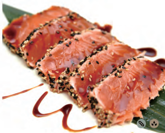
161. SAKE TATAKI salmone in salsa kabayaki