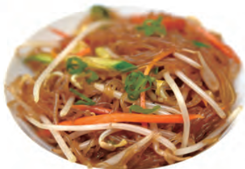
124. SPAGHETTI DI SOIA CON VERDURE