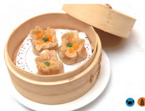
06. SHAOMAI carne, gamberi e verdure