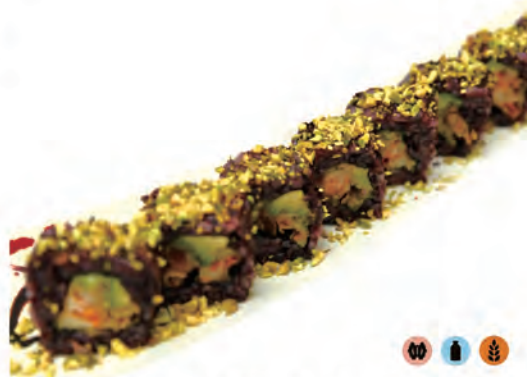
218. BLACK ZUCCA fiori di zucca fritto, avocado, maionese pistacchio