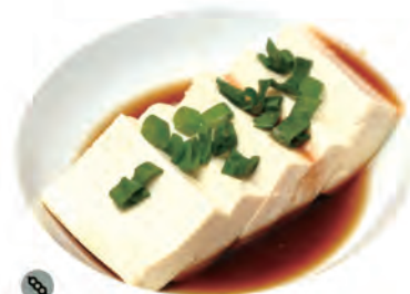
241. TOFU FRESCA tofu fresco, cipollina in salsa ponzu