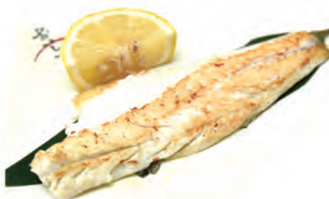
156. BRANZINO ALLA GRIGLIA