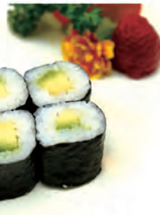
44. AVOCADO MAKI avocado