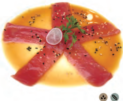
104. CARPACCIO TONNO tonno in salsa osaka