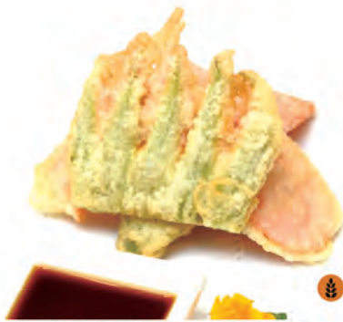
147. YASAI TEMPURA verdure miste