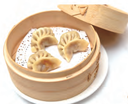
04. RAVIOLI DI CARNE verdure e carne