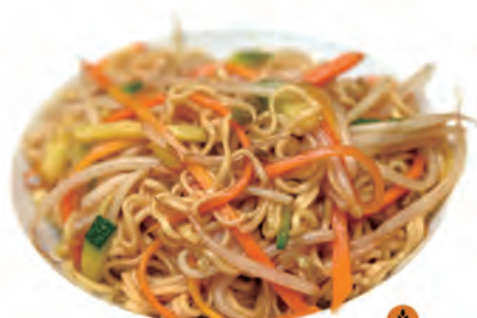
119. YASAI SOBA spaghetti di soba con verdure