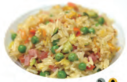
113. RISO ALLA CANTONESE