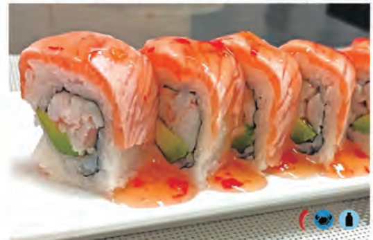
219. EBI ROLL philadelphia, gambero cotto, avocado, salmone flambe, salsa agropiccante