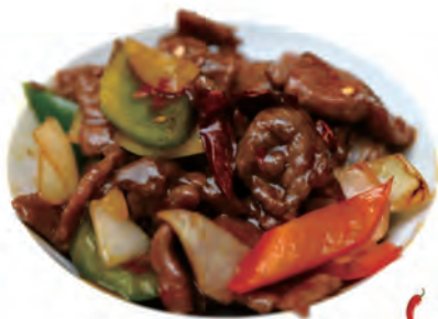
136. MANZO PICCANTE manzo,peperoni,misti, cipolle,shacha in salsa piccante