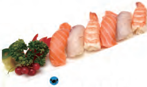
36. NIGIRI MISTO A 2pz salmone, 2pz branzino, 2pz gamberi