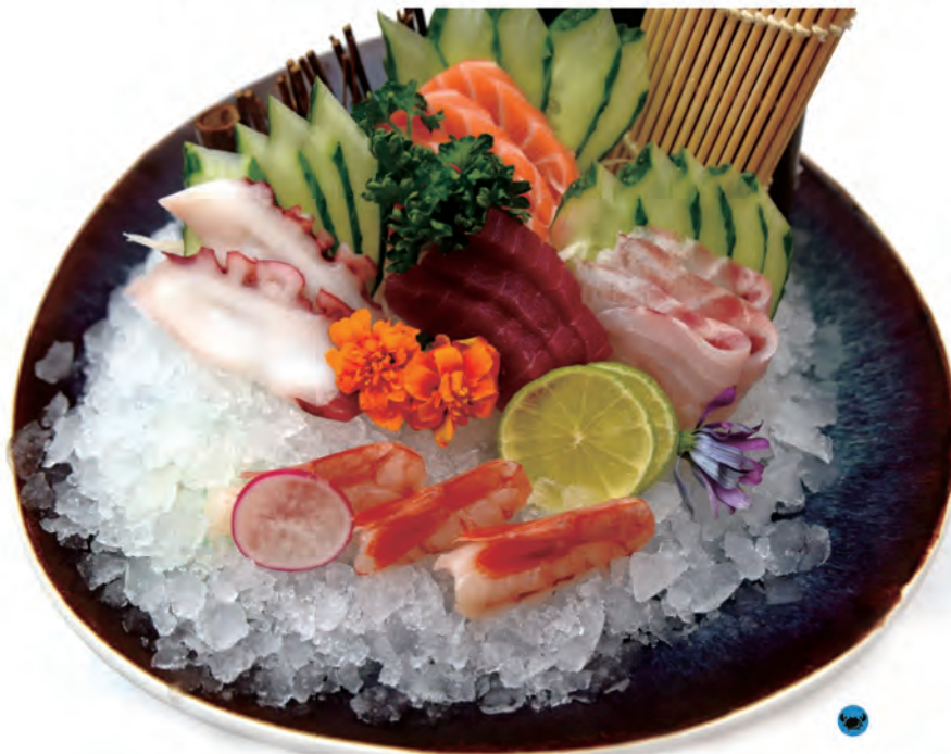
① 100.SASHIMI MISTO 3pz salmone,3pz tonno,3pz branzino ,2pz polipo,3pz gamberi crudo

i piatti con numero ① si devono ordinare una volta sola per persona