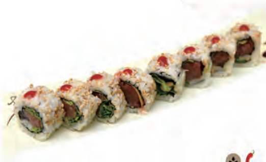
85. SPICY TUNA tonno, insalata, salsa spicy