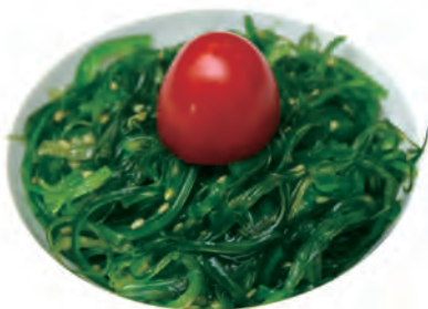
11. GOMA WAKAME alghe