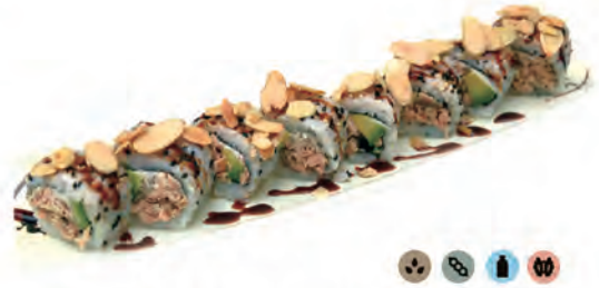
84. MIURA MAKI salmone cotto, philadelphia, avocado mandorle in salsa teriyaki