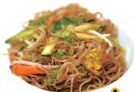
122. SPAGHETTI DI RISO CON VERDURE spaghetti di riso con verdure e uova