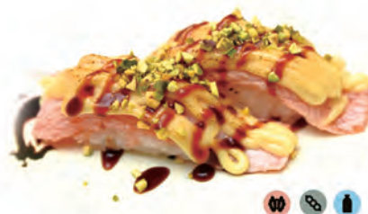
31. SAKE FLAMBE SPECIALE salsa speciale, salmone, teriyaki, pistacchio