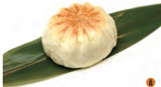
243. PANE CINESE PIASTRA pane di carne alla piastra